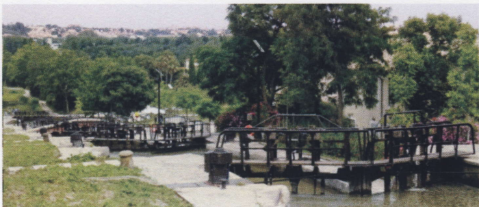
Les neuf écluses de Fonsérannes à Béziers

d'autres, plus risqués : le tunnel du Malpas et le port de Sète.