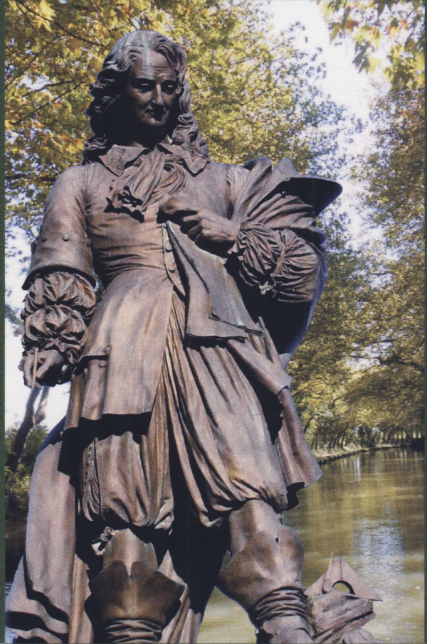
Statue de Pierre-Paul Riquet 1609-1680 Érigée à Béziers par David d'Angers en 1838

Vous partagerez les activités de notre association.