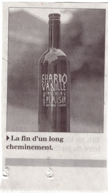
► La fin d'un long cheminement.